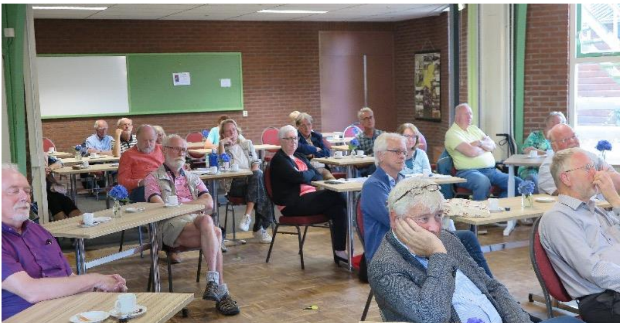
Foto onder: een deel van de aanwezigen op anderhalve meter afstand van elkaar

Vervolgens bedankt hij alle aanwezigen en stelt hij een nieuwe bijeenkomst komend voorjaar in het vooruitzicht.